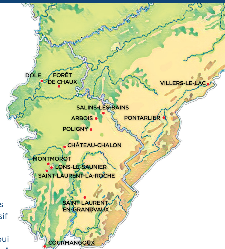
Conception : Y. Tiercy - Impression : Montparnasse Expression.

En 2023, les associations et municipalités du massif jurassien célèbrent « leur » auteur, avec l'appui de l'association LireClavel .